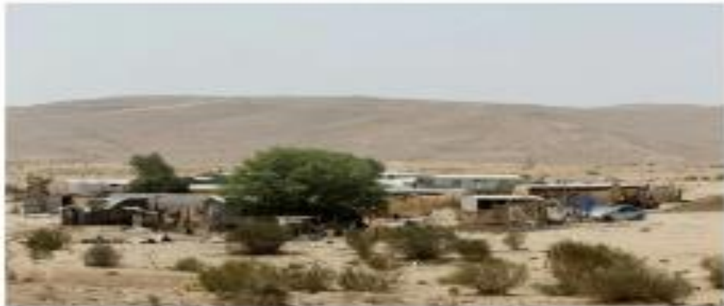
היישוב הבדואי רח'מה, בשנה שעברה.