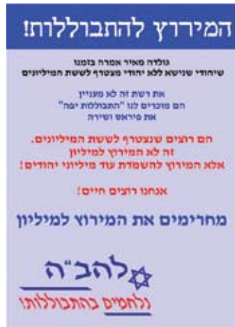
"המרוץ למיליון - המרוץ להתבוללות"

בחודש נובמבר 2011 פתח ארגון להב"ה בקמפיין כנגד תוכנית השלוויה "המרוץ למיליון" בה הופיע זוג מעורב - אישה יהודייה וגבר ערבי. בכרזה שכותרתה "המרוץ להתבוללות" קרא הארגון להחרים את התכנית: "גולדה מאיר אמרה בזמנו שיהודי שנישא ללא יהודי מצטרף לששת המיליונים / את רשת [זכיינית השידור של הסדרה ר.כ.] זה לא מעניין / הם מוכרים לנו