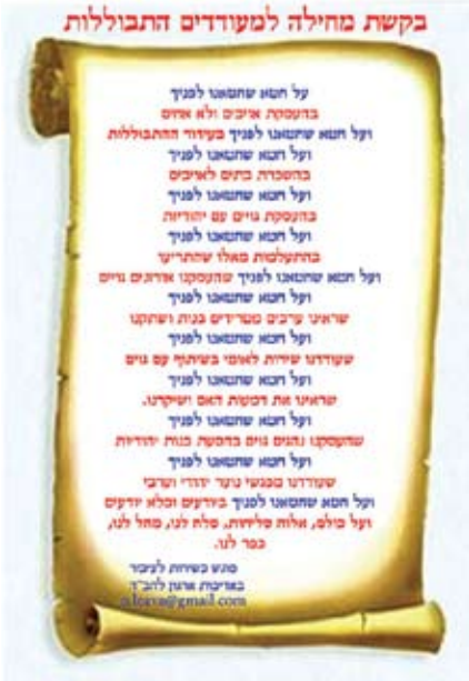
ידיד ליום הכיפורים למי שמעודד נישואי ערבים ויהודיות

תפילת "על חטא שחטאנו לפניך" הנאמרת מספר פעמים במהלך החג. הארגון מפנה אצבע מאשימה אל עבר כל מי שלדעתו תורם להתבוללות: רשתות השיווק המעסיקות גויים ובנות יהודיות אלו לצד אלו, חברות האוטובוסים המעסיקות גויים כנהגי הסעות לבתי ספר, אגודות השירות הלאומי המשימות בנות דתיות במקומות בהם נמצאים גויים ובעלי מסעדות המעסיקים מלצרים גויים לצד מלצריות יהודיות. כל אלו נדרשים לבקש סליחה ביום הכיפורים על חלקם בהתבוללות, לעבור לעבודה עברית ולהציל את בנות ישראל. פעילי הארגון מבטיחים כי יתפללו להצלחתו ויגנו על שמו של כל מי שיפריד בין ערבים ויהודיות ויפטר