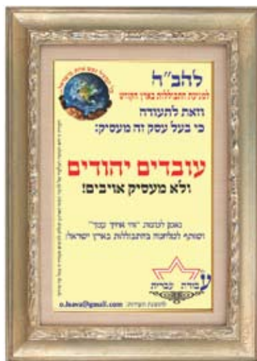
תעודות כשרות לעסקים נגד התבולות

בחודש יוני 2011 הקים ארגון להב"ה את "משמר החופים" - "הוועד להגנת הבנות בחופי הים ברחבי ישראל", שמטרתו "להגן על בנות ישראל" בחופים ולמנוע הטרדות על ידי גברים ערבים המתחזים ליהודים. עלונים אודות "משמר החופים" חולקו לבחורות