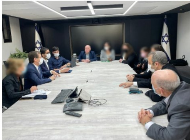
הפגישה בבית הנשיא.