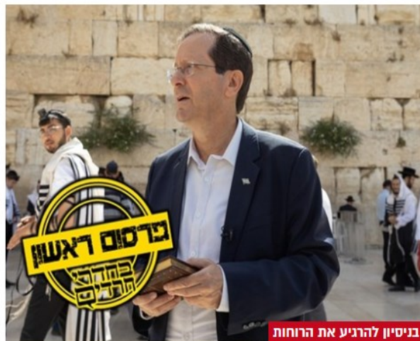
בניסיון להרגיע את הרוחות

נשיא המדינה יצחק הרצוג נועד הבוקר (רביעי) עם נציגי הארגונים הרפורמים, הקונסרבטיבים ונשות הכותל, ברקע העימות סביב כוונת הממשלה ליישם את מתווה הכותל שהוקפא בממשלה הקודמת, וכן בעקבות מה שהפך לעימות חודשי בתפילות ראש חודש ברחבת הכותל באמצעות נשות הפרובוקציה.