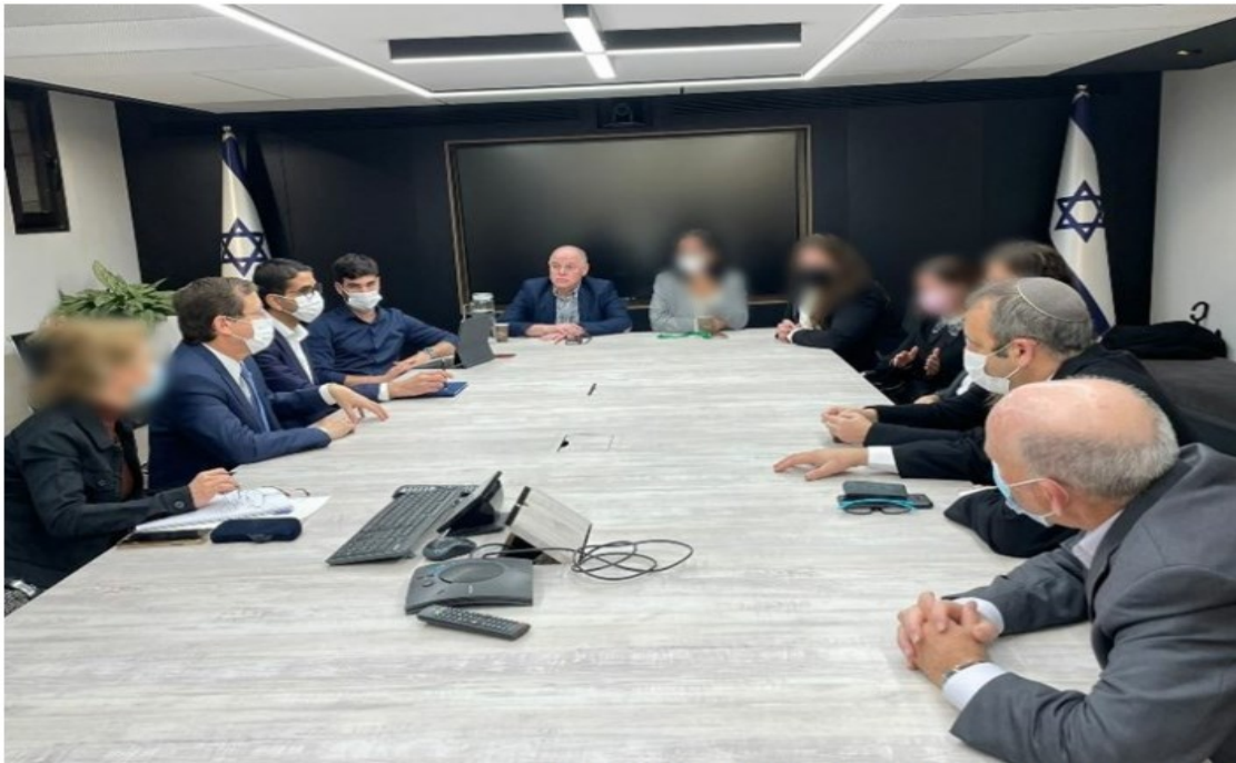
הפגישה בבית הנשיא.