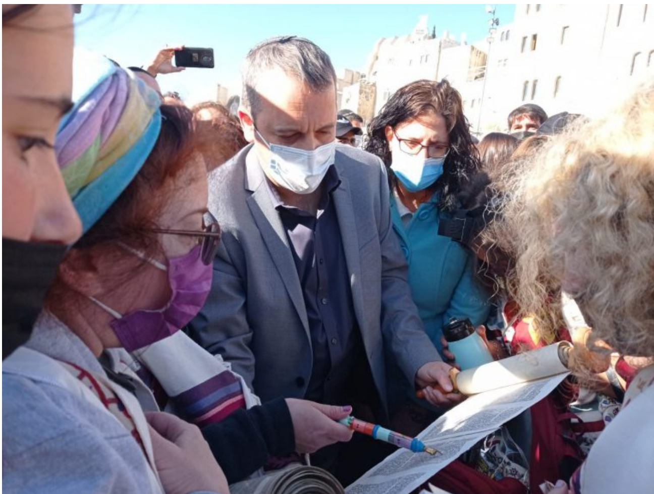
קריב עם נשות הכותל