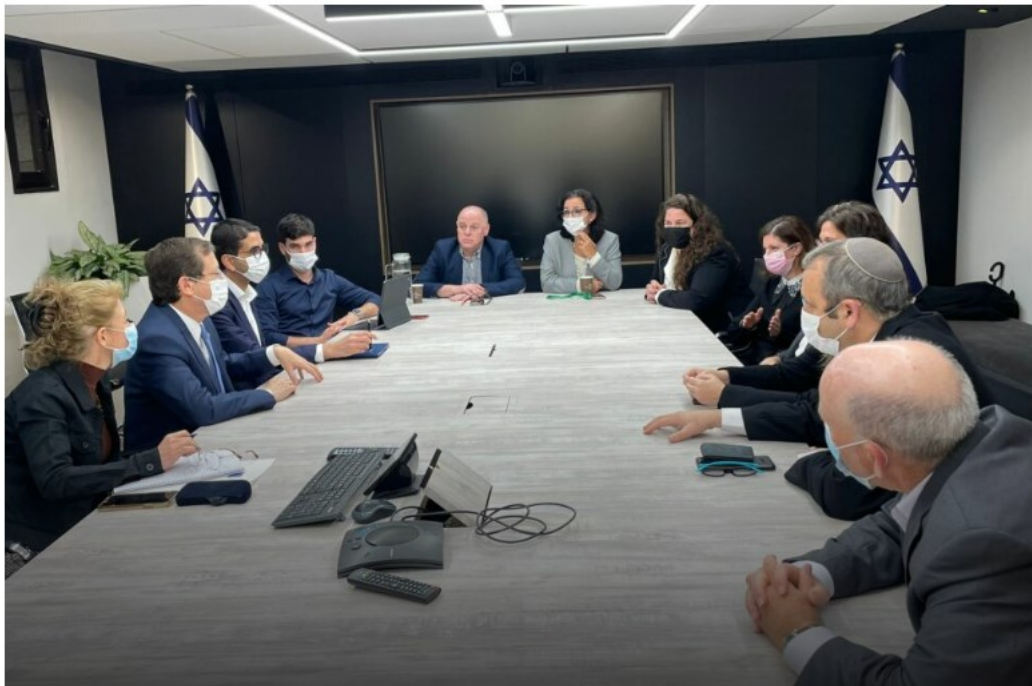
הרצוג וחברי הכנסת קריב וטל עם נציגי התנועה הרפורמית והמסורתית